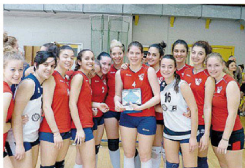
MODENA La Vgm Under 18

Un successo ben oltre le aspettative quello del secondo "Torneo della Liberazione - Memorial Dario" organizzato dalla Polisportiva Villa d'oro in collaborazione con Modena Est e Gino Nasi, le consorziate del marchio di volley giovanile Vgm.