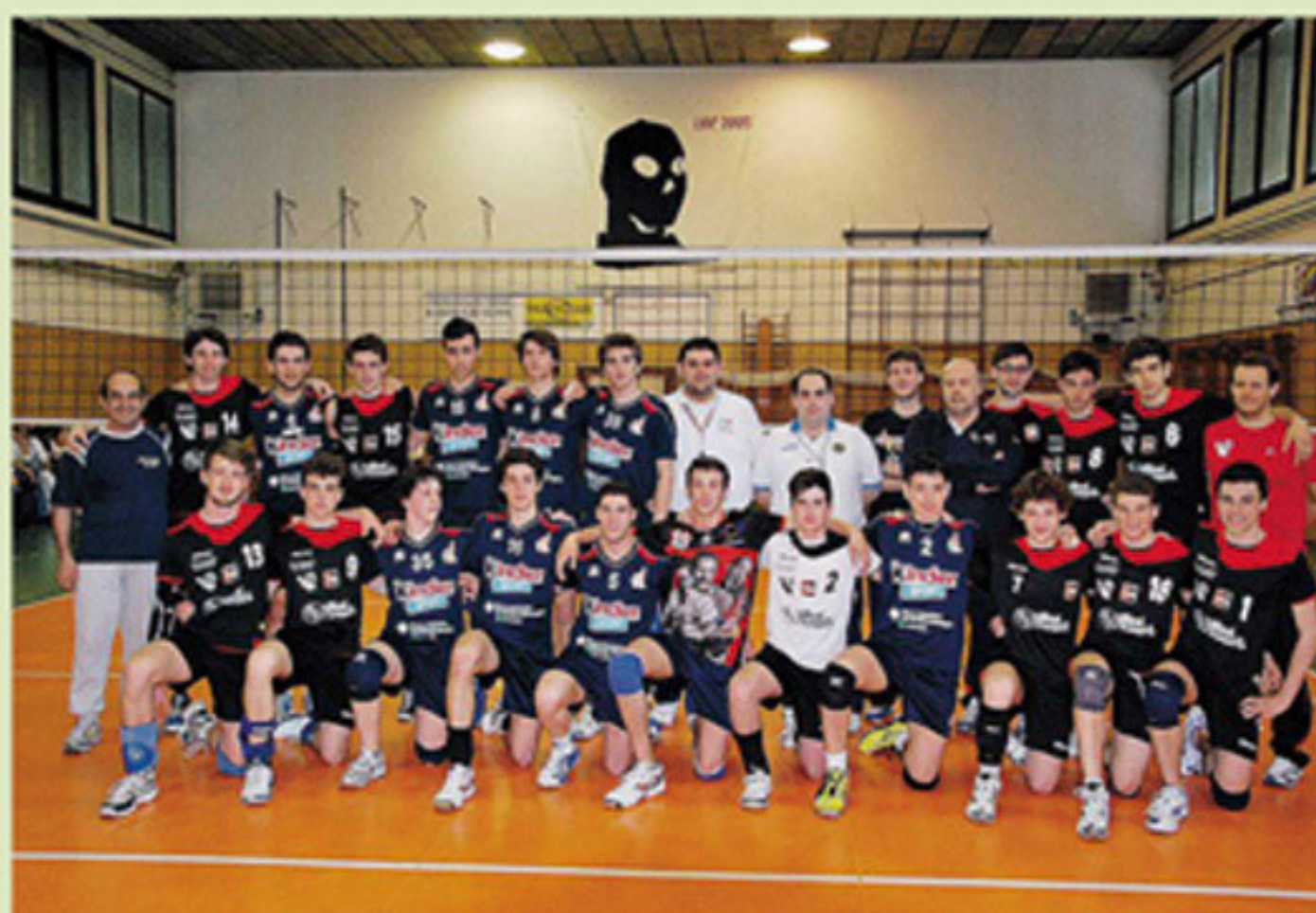
TUTTO PRONTO Le finaliste dell'edizione 2012

Le finalissime sono previste alle ore 17 per tutte le categorie, ognuna nel loro impianto, mentre il pranzo sarà un momento per stare tutti insieme alle palestre Lanzi della Polisportiva Villa d'oro. Presenti le formazioni provinciali di Vgm, San Prospero, Sdp Anderlini, Maranello e Casa Modena, insieme alle reggiane San Martino in Rio e San Michele, ai piacentini dell'Ardavolley, ai veneti dello Schio e ai trentini dell'Arco-Riva.