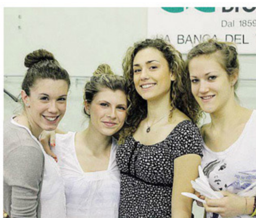
MODENA Lo staff 'Luther'