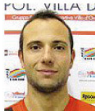
Malavolta (National Tr.)

Un poker di modenesi al via nel prossimo campionato di serie B2 maschile: si tratta della retrocessa Stadium, della neopromossa National Transports e di due formazioni che già si sono ben disimpegnate nel torneo scorso, cioè Sassuolo e Fanton Modena Est. La prima sale in B1, seconda e terza ai play off, retrocedono le ultime quattro.