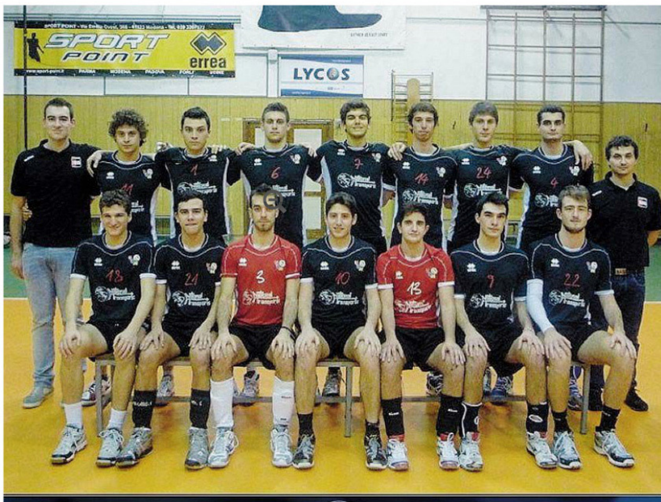
D MASCHILE La Pallavolo Vgm