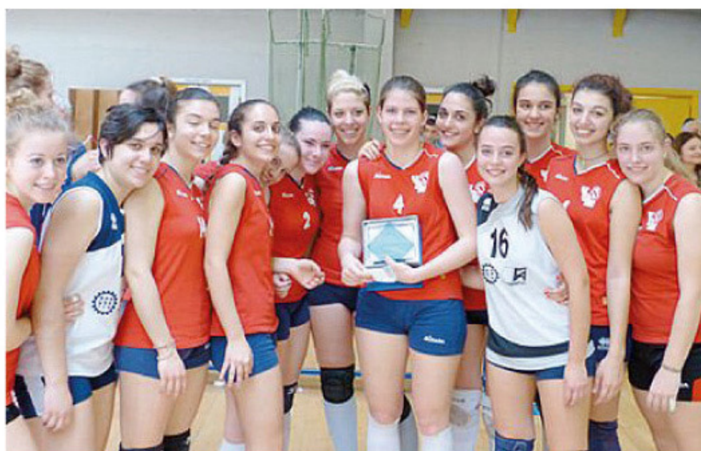
Le ragazze della Pallavolo VGM vincitrici nell'Under 18 femminile

Trionfano nella categoria Under 18 del Torneo della Liberazione-Memorial Dario