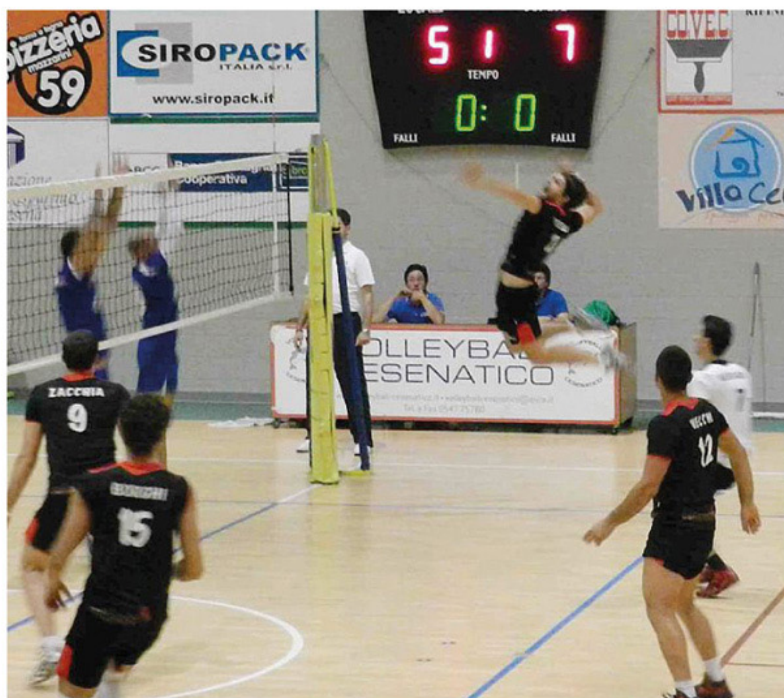
Una foto destinata agli annali della Villa d'Oro qui impegnata nella stagione nella finale dei play off a Cesenatico