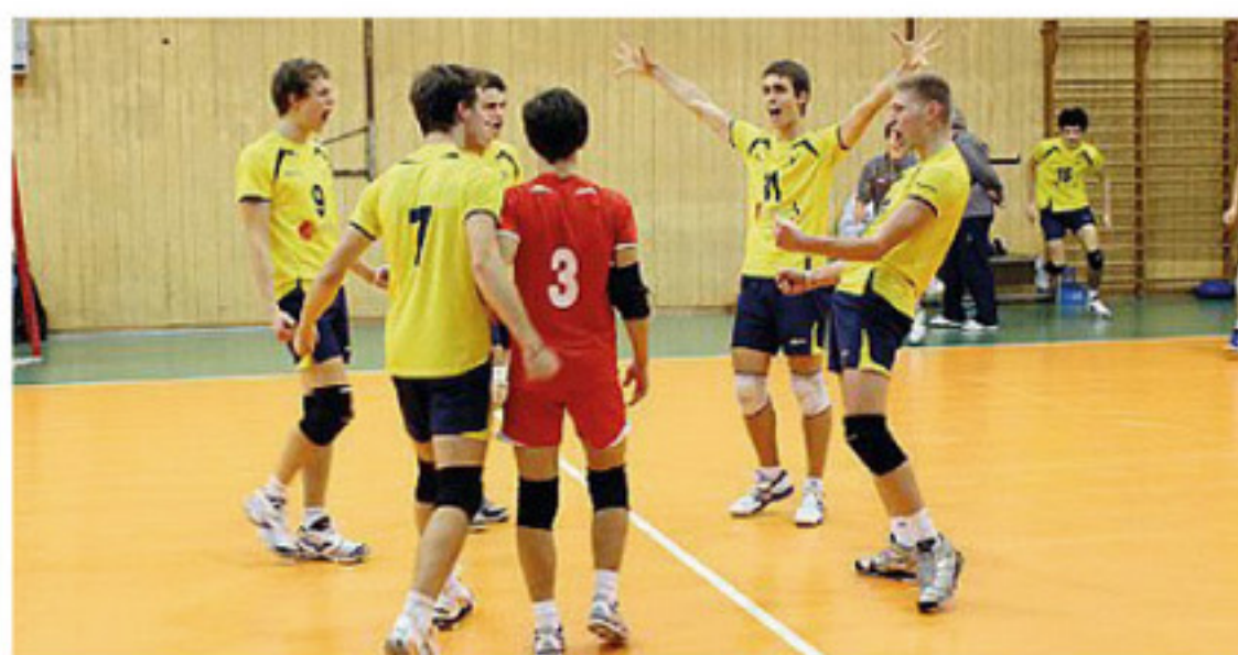
L'Argentario festeggia il successo nella categoria Under 17

Sabato, nonostante le condizioni meteo inclementi e la neve che aveva messo in peri-