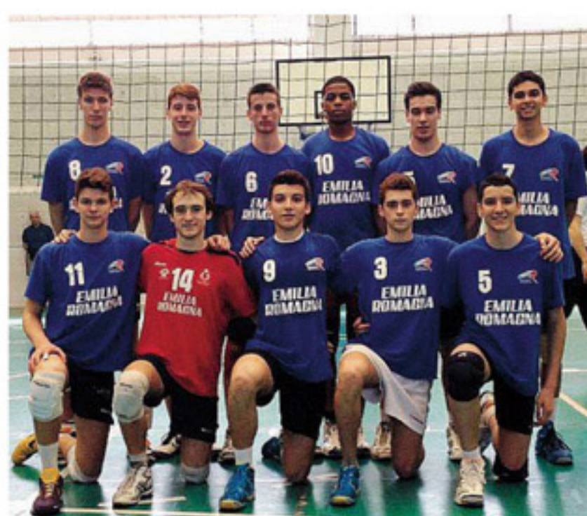
MODENA La selezione Emilia Romagna

Insomma, una giornata di volley ben giocato e di grandissimo divertimento per un torneo che ha goduto del patrocinio di Modena Città Europea dello Sport e che ha visto il Luther Staff ancora una volta prontissimo nell'organizzazione delle partite, nella gestione delle cinque palestre campo di gara e nella preparazione del grande pranzo che ha coinvolto tutte e 30 le squadre presso le palestre Lanzi.