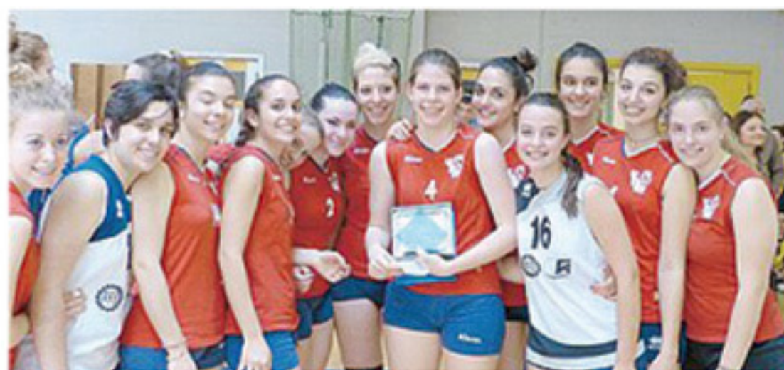
La formazione Vgm che si è imposta nella finale under 18

Ecco categoria per categoria i vincitori. Nell'Under 17 maschile successo per la selezione regionale dell'Emilia-Romagna che ha sconfitto in finale 2-0 i pari età di