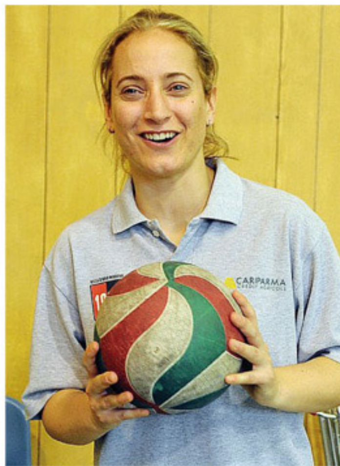
L'allenatrice romana e il volley: un amore che dura da 27 anni

Esperienza mitica, idea geniale: fortificare lo spirito con metodi da "marcia della sopravvivenza", come fece