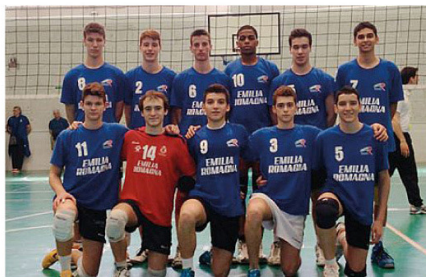
La Selezione Emilia Romagna che ha trionfato nell'Under 17 maschile

Under 17 maschile: successo per la selezione regionale