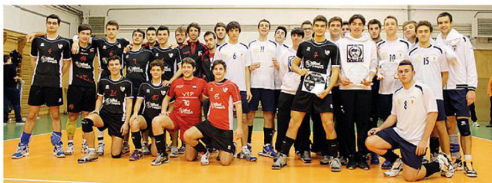
I finalisti del torneo KVL categoria Under 19 in cui il successo è andato alla Pallavolo VGM

Grande successo per l'edizione 2012 del torneo KVL di pallavolo, che ha visto impegnate nel fine settimana ben 26 squadre suddivise in tre categorie, per un totale di 350 atleti che hanno popolato le palestre di Villa d'Oro, Polisportiva Modena Est e Gino Nasi.