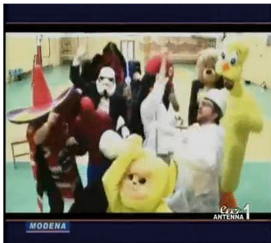
Antenna 1 9 marzo 2013