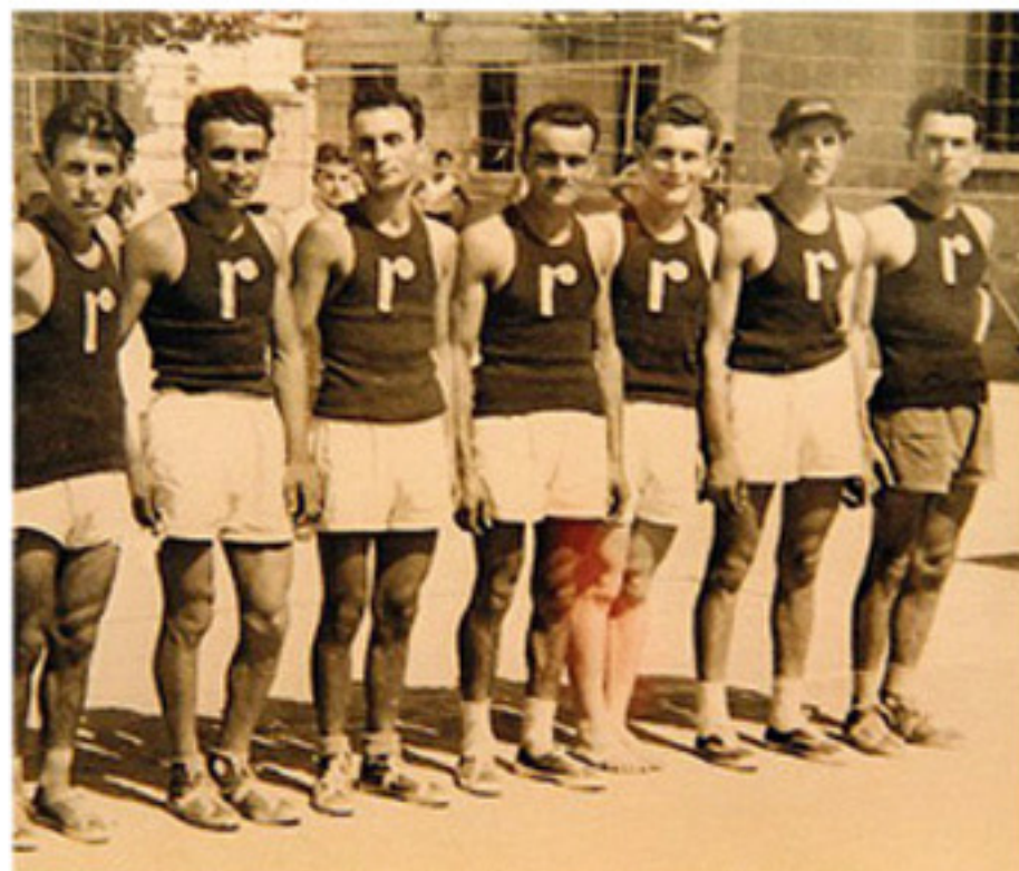
La formazione originaria della Ruentes, poi denominata Villa d'Oro nel 1952

zona: nacque così la mia avventura di allenatore di pallavolo, inizialmente di una squadra femminile. Alle ragazze che iniziai ad allenare la federazione del Pci aveva regalato il pallone per giocare, di cui io ero il depositario e che all'occorrenza aggiustavo personalmente o lo portavo da un calzolaio di corso Vittorio Emanuele. Della manutenzione del campo da gioco se ne occupavano invece i ragazzi stessi che all'inizio, non avendo strumenti adatti a disposizione, allenavo con mezzi di fortuna e grazie agli