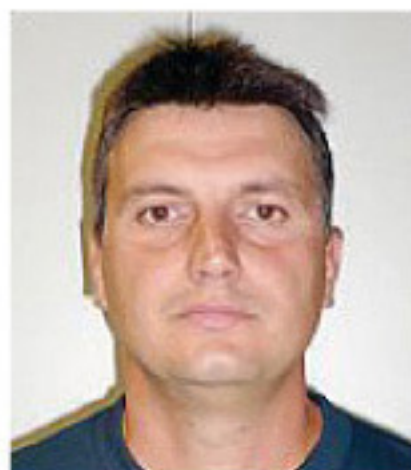
Pinca tecnico della Stadium

della prestazione dei miei ragazzi: siamo stati molto bravi in battuta, efficaci a muro ed attenti anche ai minimi particolari