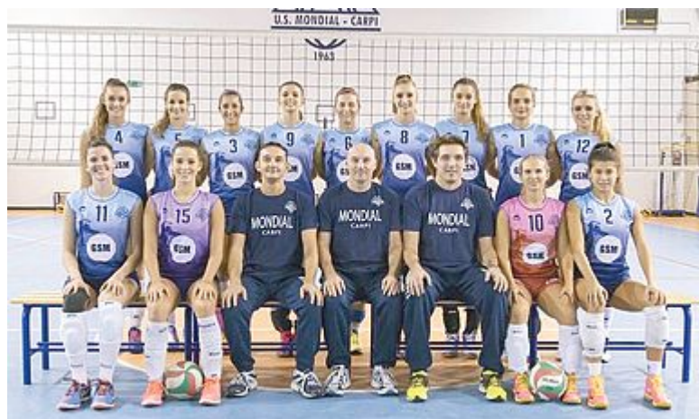
SQUADRE AL TOP In alto la rosa completa dell'Erboristeria del Viale Villa d'Oro, sotto quella della 'matricola' G.S.M. Carpi